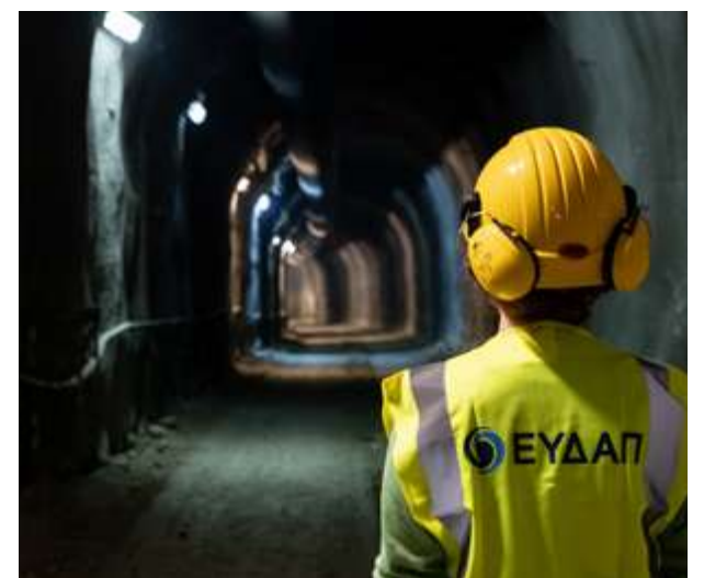
Εργασίες Κατασκευής Σήραγγας του Κέντρου Επεξεργασίας Λυμάτων Ραφήνας - Πικερμίου - Σπάτων - Αρτέμιδας, Πηγή: Αρχείο ΕΥΔΑΠ

• Στην Εταιρική Διακυβέρνηση , η ΕΥΔΑΠ βασίζεται στη σχετική εγχώρια, αλλά και διεθνή νομοθεσία. Ακολουθώντας ένα πλήρες σύνολο πολιτικών εταιρικής διακυβέρνησης που ρυθμίζουν τον τρόπο λειτουργίας στο εσωτερικό, αλλά και σε όλο το φάσμα των ενεργειών της, η ΕΥΔΑΠ προάγει την αντίληψη της επιχειρηματικής ηθικής στη λήψη αποφάσεων και δεσμεύεται για τη διαφάνεια και την προώθηση των συμφερόντων όλων των μερών που συνδέονται με τη δραστηριότητά της.