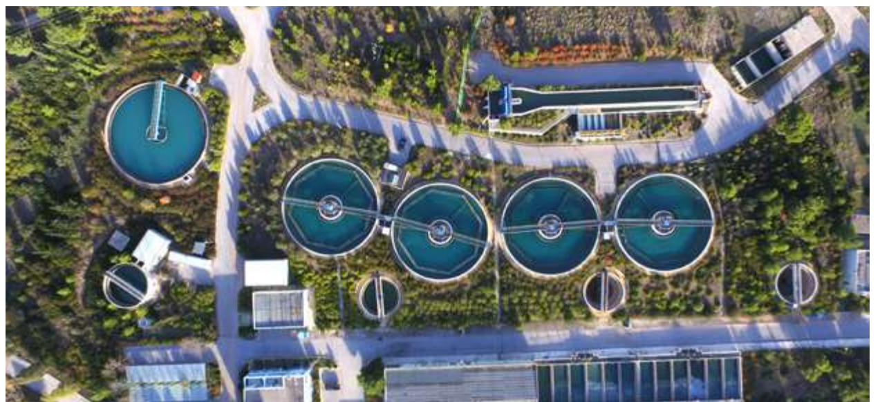
Μονάδα Επεξεργασίας Νερού Ασπροπύργου

• Στην Κοινωνία , μέριμνα της Εταιρείας είναι η διασφάλιση πρόσβασης όλων σε ανώτερο ποιοτικά και προσιτό οικονομικά νερό, δίνοντας έμφαση ταυτόχρονα σε θέματα προστασίας των εργασιακών και ανθρωπίνων δικαιωμάτων, μέσα σε ένα πλαίσιο αξιοκρατίας και διαφάνειας, όπου προάγεται η ισότητα και η ασφαλής εργασία. Η διασφάλιση των συνθηκών εργασίας και η προστασία της υγείας και της ασφάλειας των εργαζομένων, η προώθηση της πολυμορφίας και των ίσων ευκαιριών στην εργασία, καθώς και η πελατοκεντρική προσέγγιση, αποτελούν βασικές προτεραιότητες της Εταιρείας και εναρμονίζονται με τους στρατηγικούς στόχους της.