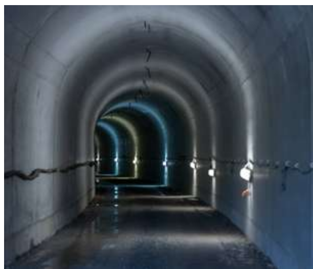
Σήραγγα διέλευσης αγωγών του Κέντρου Επεξεργασίας Λυμάτων Ραφήνας - Πικερμίου - Σπάτων - Αρτέμιδας, Πηγή: Αρχείο ΕΥΔΑΠ