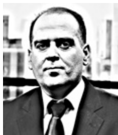
Γράφει ο Λουκάς Γεωργιάδης

Π ερισσότερους δικαιούχους με μεγαλύτερα ποσά περιλαμβάνει η περίμετρος των μέτρων που ανακοίνωσε χτες ο πρωθυπουργός Κυριάκος Μητσοτάκης για συνταξιούχους, οικογένειες και ενοικιαστές οι οποίοι παίρνουν και τη «μερίδα του λέοντος» από το πακέτο παροχών ύψους 500 εκατ. ευρώ που δίνει η κυβέρνηση, αξιοποιώντας το υπερπλεόνασμα του 2025.