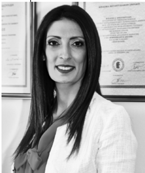
Δικηγόρος Αθηνών Παρ' Αρείω Πάγω

Συνοψίζοντας, το φαινόμενο των «date-rape drugs» αποτελεί μια ιδιαίτερα ύπουλη μορφή σεξουαλικής βίας που απαιτεί κοινωνική ευαισθητοποίηση, άμεση ανταπόκριση των αρχών και ενίσχυση των αποδεικτικών μηχανισμών. Κεντρικό ζητούμενο παραμένει η ουσιαστική υποστήριξη του θύματος, καθώς και η πρόληψη μέσω ενημέρωσης και εμπιστοσύνης στους θεσμούς της δικαιοσύνης.