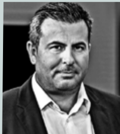
Γράφει ο Γιώργος Κασιάνης

Η Dataways ιδρύθηκε το 2000 στη Θεσσαλονίκη και αποτελεί σήμερα έναν από τους κορυφαίους παρόχους IT λύσεων στην Ελλάδα. Με 26 χρόνια παρουσίας στον κλάδο και υλοποιήσεις έργων σε οκτώ χώρες, η εταιρεία έχει κατακτήσει μια διακριτή θέση στο ελληνικό τεχνολογικό οικοσύστημα, συνδυάζοντας βαθιά τεχνική εξειδίκευση με προσωποποιημένη προσέγγιση σε κάθε συνεργασία. Από τα πρώτα χρόνια λειτουργίας της έως σήμερα, η Dataways διατηρεί αναλλοίωτη τη δέσμευσή της στην αριστεία με ένα διαρκώς εξελισσόμενο χαρτοφυλάκιο υπηρεσιών και πελατολόγιο που περιλαμβάνει ορισμένες από τις πιο απαιτητικές εταιρείες της ελληνικής αγοράς.