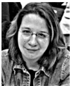
Γράφει η Ιωάννα Ντάνη

Η υπόθεση θανάτου της 19χρονης Μυρτώ στο Αργοστόλι συνεχίζει να συγκλονίζει, καθώς νέα στοιχεία και καταγγελίες ανοίγουν ακόμη πιο σκοτεινά μέτωπα στην έρευνα. Στο επίκεντρο πλέον βρίσκονται οι δημόσιες τοποθετήσεις του πατέρα της, ο οποίος μιλά ανοικτά για οργανωμένο κύκλωμα μαστροπείας, υποστηρίζοντας πως η κόρη του παγιδεύτηκε από πρόσωπα που επιδίωκαν να την εκμεταλλευτούν.