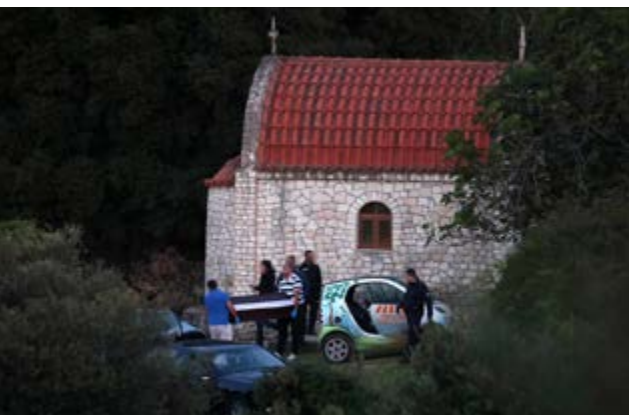
Το εκκλησάκι όπου βρέθηκε νεκρός ο πρώην σύντροφός της

ΜΕΣΑ ΣΤΟ ΑΥΤΟΚΙΝΗΤΟ ΤΗΣ ΒΡΕΘΗΚΕ ΝΕΚΡΗ Η ΕΛΕΥΘΕΡΙΑ ΓΙΑΚΟΥΜΑΚΗ