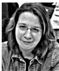
Γράφει η Ιωάννα Ντάνη

Η σύλληψη ενός 33χρονου στη Ζάκυνθο έδωσε τέλος στην αναζήτησή του από τις αστυνομικές αρχές μετά από σοβαρή καταγγελία ενδοοικογενειακής βίας που είχε υποβληθεί σε βάρος του από την πρώην σύντρόφό του. Το περιστατικό σημειώθηκε στην περιοχή Καλλιτέρο και κινητοποιήσε άμεσα την τοπική Αστυνομική Διεύθυνση, καθώς σύμφωνα με τα στοιχεία της υπόθεσης ο άνδρας όχι μόνο φέρεται να επιτέθηκε στη 43χρονη γυναίκα, αλλά στη συνέχεια προσπάθησε να διαφύγει επιτιθέμενος και στους αστυνομικούς που έσπευσαν στο σημείο.