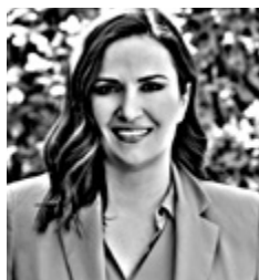
Γράφει η Αλεξία Τασούλη

Ο Αμερικανός πρόεδρος Ντόναλντ Τραμπ δήλωσε ότι θα παρατείνει την κατάπαυση του πυρός με το Ιράν έως ότου η Τεχεράνη υποβάλει ενιαία πρόταση για τον οριστικό τερματισμό της σύγκρουσης. «Με βάση το γεγονός ότι η κυβέρνηση του Ιράν είναι σοβαρά κατακερματισμένη, όχι αναπάντεχα, και κατόπιν αιτήματος του στρατάρχη Ασίμ Μουνίρ και του πρωθυπουργού Σεχμπάζ Σαρίφ του Πακιστάν, μας ζητήθηκε να αναστείλουμε την επίθεσή μας στη χώρα μέχρις ότου οι ηγέτες και οι εκπρόσωποί τους μπορέσουν να παρουσιάσουν μια ενιαία πρόταση και να ολοκληρωθούν οι συζητήσεις, με τον έναν ή τον άλλον τρόπο», έγραψε ο Τραμπ στην Truth Social.