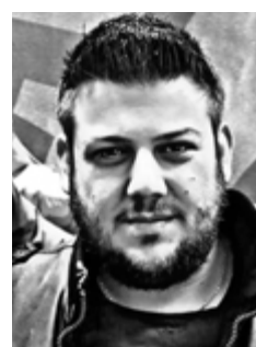
Γράφει ο Χρήστος Γιαννούλης

Για να συμβεί αυτό, οι επτά φορές πρωταθλητές Ευρώπης θα πρέπει να «σπάσουν» την έδρα της Βαλένθιας, η οποία τερμάτισε δεύτερη και θα είναι ο αντίπαλος του Παναθηναϊκού έχοντας μάλιστα και το πλεονέκτημα της έδρας. Οι «πράσινοι» ταξιδεύουν τη Δευτέρα στην Ισπανία για να δώσουν τις δύο πρώτες αναμετρήσεις απέναντι στις «νυχτερίδες», την Τρίτη και την Πέμπτη. Η ομάδα του Εργκίν Αταμάν έχει τις προσωπικότητες, το ταλέντο και τη δυνατότητα να πάρει τουλάχιστον μια νίκη στην έδρα του αντιπάλου, έτσι ώστε στα δύο επόμενα παιχνίδια που θα ακολου-