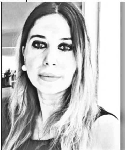
Συμβολαιογράφος Καβάλας, Εφετείου Θράκης