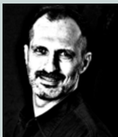
Γράφει ο Κωνσταντίνος Δαυλός

Η δημογραφική κρίση, που εξελίσσεται στην Ελλάδα εδώ και πολλές δεκαετίες, εμφανίζει συνεχώς νέους τρόπους με τους οποίους επηρεάζει ή θα επηρεάσει την οικονομία και την ανάπτυξη της χώρας. Ένα άμεσα επηρεαζόμενο πεδίο είναι αυτό του ασφαλιστικού συστήματος. Τα στοιχεία της Eurostat είναι αποκαλυπτικά: ο πληθυσμός της χώρας ήδη συρρικνώνεται δραματικά και μέχρι το 2030 θα είναι στα 10,2 εκατομμύρια (άλλες μελέτες τον κατεβάζουν ακόμη και κάτω από τα 10 εκατομμύρια), μία πορεία που θα συνεχιστεί κατεβάζοντας τον πληθυσμό μόλις στα 7,2 εκατομμύρια έως το 2100. Την ίδια στιγμή, η γήρανση επιταχύνεται και οι γεννήσεις παραμένουν σε ιστορικά χαμηλά επίπεδα. Το ερώτημα δεν είναι πλέον αν το Ασφαλιστικό θα πιεστεί, αλλά τι πρέπει να αλλάξει για να παραμείνει βιώσιμο.