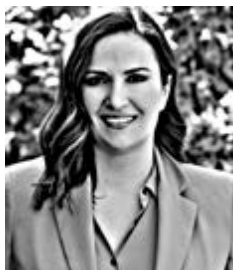
Γράφει η Αλεξία Τασούλη

■ Εκινά σήμερα η Άτυπη Σύνοδος των Ευρωπαίων Ηγετών στην Αγία Νάπα, στη σκιά και της τουρκικής αδιαλλαξίας καθώς υποβρύχιο και πυραυλάκατος της γείτονος θα βρίσκονται στην κατεχόμενη Κερύνεια και το κατεχόμενο λιμάνι της Αμμοχώστου, την ώρα που οι εργασίες της συνόδου θα βρίσκονται σε εξέλιξη. Σε σχετική ανακοίνωσή της, η «Διοίκηση Δυνάμεων Ασφαλείας» των Κατεχομένων αναφέρεται... σε επίσκεψη λόγω «εορτασμών της Ημέρας Εθνικής Κυριαρχίας και Παιδιού».