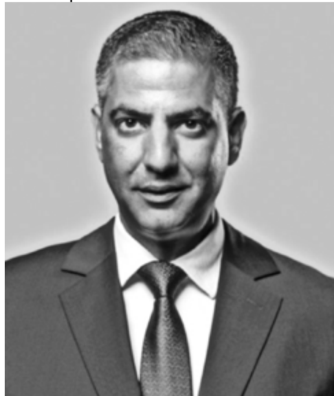
Λέκτορας Νομικής στο Πανεπιστήμιο Λευκωσίας, LL.B Law (Bristol), Ph.D in Law - International Law and Human Rights (Kent), διευθυντής Μονάδας Νομικής Κλινικής Πανεπιστημίου Λευκωσίας