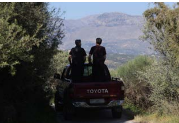
Επί τέσσερις μέρες την έψαχναν σε όλα τα πιθανά σημεία