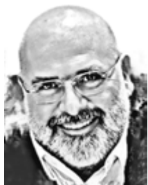
Γράφει ο Γιώργος Σ. Σκορδίλης

Ο ι νέες επιθέσεις κατά εμπορικών πλοίων στα Στενά του Ορμούζ επαναφέρουν με τον πλέον δραματικό τρόπο τα όσα βιώνουν τα πληρώματα των πλοίων που βρίσκονται εγκλωβισμένα στην περιοχή, ενώ την ίδια ώρα έχει επιβεβαιωθεί ότι στις 22 Απριλίου σημειώθηκαν πυρά κατά τουλάχιστον τριών εμπορικών πλοίων στο Στενό, με ζημιές σε ένα από αυτά και χωρίς απώλειες μεταξύ των πληρωμάτων.