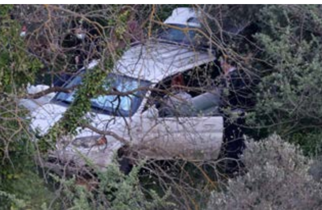
Το αυτοκίνητο στο οποίο βρέθηκε το πτώμα της