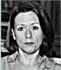
Γράφει η Ρεγγίνα Σαβούρδου

Η αγορά κατοικίας συνεχίζει την ανοδική της πορεία και κατά τη διάρκεια του πρώτου τριμήνου του 2026, όπως καταγράφει το spitogatos.gr, με αυξήσεις που αποτυπώνουν μία συνεχιζόμενη και σταθερή ζήτηση τόσο στα αστικά κέντρα όσο και σε επιλεγμένες περιφερειακές αγορές. Σύμφωνα με τα διαθέσιμα στοιχεία, οι τιμές πώλησης κατοικιών ενισχύθηκαν κατά 6,5% στην Αττική, κατά 9,7% στη Θεσσαλονίκη και κατά 10,9% στο υπόλοιπο της χώρας σε σχέση με το αντίστοιχο τρίμηνο του 2025.