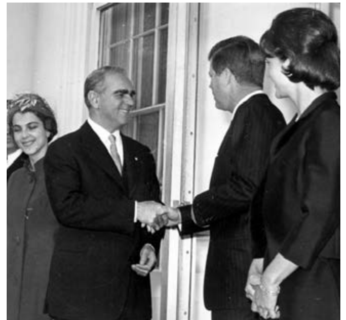
Με τον Τζον Κένεντι στον Λευκό Οίκο τον Απρίλιο του 1961

Στις εκλογές της 3ης Νοεμβρίου 1963 ηγήθηκε της ΕΡΕ, αλλά υπό το βάρος των καταγγελιών της αντιπολίτευσης ηττήθηκε από την Ένωση Κέντρου του Γεωργίου Παπανδρέου. Τότε ο Καραμανλής παραιτήθηκε από την ηγεσία της ΕΡΕ και έφυγε για το Παρίσι, όπου ιδιώτευσε επί 11 χρόνια μέχρι τη Μεταπολίτευση.