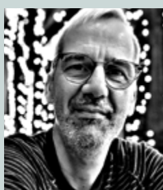
Γράφει ο Γιώργος Κατικός

Φ ανατικούς «φίλους» (θέσεις αγοράς long) αλλά και φανατικούς «εχθρούς» (θέσεις πώλησης short) έχει αποκτήσει τους τελευταίους μήνες η Metlen, με αφορμή την προειδοποίηση για την πορεία των EBITDA που είχε κάνει στις αρχές Φεβρουαρίου. Τότε είχε ενημερώσει πως τα EBITDA για το 2025 δεν θα είναι 1 δισ. ευρώ αλλά 750 εκατ. ευρώ, με αποτέλεσμα να υποχωρήσει σημαντικά η μετοχή. Ωστόσο, διατήρησε την εκτίμηση για το 2026 τονίζοντας πως θα πετύχει περισσότερα από 1 δισ. ευρώ. Είχε προηγηθεί η είσοδος στο Χρηματιστήριο του Λονδίνου, η οποία είχε οδηγήσει τη μετοχή έως και τα 57 ευρώ τον περασμένο Αύγουστο. Από εκεί και μετά είχε διολισθηθεί μέχρι και τα 40 ευρώ, καθώς είχαν επιτευχθεί οι στόχοι και η αγορά περίμενε τώρα τους νέους καταλύτες.