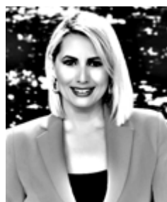
Γράφει η Κατερίνα Παπακωστοπούλου