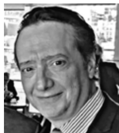
Γράφει ο Νίκος Χιδίογλου

πε, «αντιμετωπίζουμε πιθανώς μια κρίση σημαντικών διαστάσεων. Είναι θέμα χρόνου, αν το μπλόκο στα Στενά του Ορμούζ συνεχιστεί, να έχουμε σημαντικές διαταραχές στον εφοδιασμό του πετρελαίου και προϊόντων. Θα έχουμε σημαντικές αυξήσεις στις τιμές ενέργειας, ελλείψεις στα λιπάσματα, αύξηση του πληθωρισμού και μείωση της ανάπτυξης».