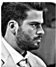
Γράφει ο Χρήστος Μυτιλινιός

Αντιθέτως, ήρθε σε μια περίοδο κατά την οποία η συζήτηση γύρω από τις υποθέσεις που χειρίζεται η Ευρωπαϊκή Εισαγγελέα έχει αποκτήσει σαφές πολιτικό αποτύπωμα. Για αυτό και η χθεσινή τοποθέτηση Φλωρίδη είχε διπλό αποδέκτη: αφενός την ίδια την Ευρωπαϊκή Εισαγγελέα, αφετέρου το εσωτερικό πολιτικό ακροατήριο, στο οποίο η κυβέρνηση θέλει να δείξει ότι δεν αποδέχεται λογικές «δικογραφιών σε δόσεις».