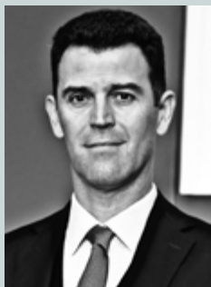
Γράφει ο Κώστας Παπαγρηγόρης