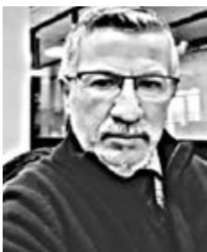
Γράφει ο Γιώργος Γεραφέντης

Τον απόλυτο εφιάλτη έζησε μια 70χρονη γυναίκα, η οποία έπεσε θύμα άγριας ενδοοικογενειακής βίας μέσα στο ίδιο της το σπίτι στην περιοχή της Χαλκίδας. Σύμφωνα με αστυνομικές πηγές, ο ξυλοδαρμός σημειώθηκε το βράδυ της Δευτέρας, όταν η 46χρονη κόρη της και ο 47χρονος σύντροφός της επιτέθηκαν με πρωτοφανή αγριότητα στην ηλικιωμένη γυναίκα. Όπως καταγγέλθηκε, κόρη και σύντροφος χτύπησαν επανειλημμένα το θύμα με γροθιές και κλοτσιές στο κεφάλι και σε διάφορα σημεία του σώματός της, προκαλώντας της σοβαρά τραύματα. Η κατάσταση εκτροχιάστηκε όταν η γυναίκα κατέρρευσε στο πάτωμα και οι φερόμενοι δράστες τη σήκωσαν, τη μετέφεραν στο μπάνιο και της έριξαν παγωμένο νερό.