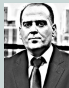
Γράφει ο Λουκάς Γεωργιάδης

4. Η ανάπτυξη διαμορφώθηκε στο 2,3% λόγω της αύξησης των επενδύσεων κατά 6,7% και της ιδιωτικής κατανάλωσης κατά 1,9%, φτάνοντας στα 234,8 δισ. ευρώ.