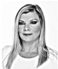
Γράφει η Λίδια Μπόλα

Μ ε ένα νέο πακέτο παρεμβάσεων, ύψους 500 εκατ. ευρώ, που στοχεύει σε οικογένειες με παιδιά, συνταξιούχους, ενοικιαστές, αγρότες, υπερχρεωμένους οφειλότες με παλιά χρέη και ομάδες που πλήττονται περισσότερο από τις πληθωριστικές πιέσεις, η κυβέρνηση επαναφέρει σε πρώτο πλάνο την οικονομία και τις πολιτικές ενίσχυσης των εισοδημάτων, με τον Κυριάκο Μητσοτάκη να μιλά για «ένα ακόμη ανάχωμα στην κρίση», χωρίς, όπως επεσήμανε, να αμφισβητείται η δημοσιονομική ισορροπία.