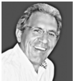
Γράφει ο Φώτης Σιούμπουρας

χρόνια σαν σήμερα, στις 23 Απριλίου 1998) αποτελεί αφορμή όχι μόνο για μνήμη αλλά και για αναστοχασμό γύρω από το πολιτικό του έργο και τη διαχρονική του επιρροή.