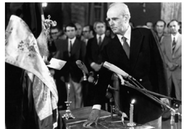
Ορκίζεται πρωθυπουργός από τον Αρχιεπίσκοπο Σεραφείμ στις 24 Ιουλίου 1974