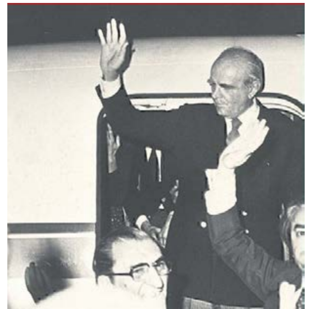
Η θριαμβευτική επιστροφή του στην Ελλάδα στις 2 το πρωί στις 24 Ιουλίου 1974