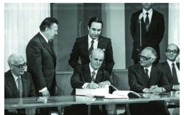
Στις 28 Μαΐου 1979 υπογράφει στο Ζάππειο Μέγαρο τη Συνθήκη Προσχώρησης της Ελλάδας στην ΕΟΚ